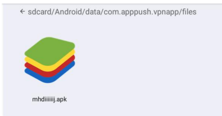
شکل ۷ فایل دانلود شده به صورت خودکار