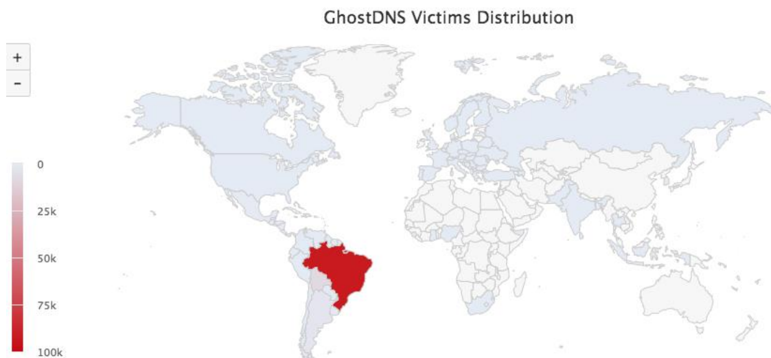
تصویر 4: توزیع قربانیان GhostDNS

بر اساس لاگ‌های مربوط به GhostDNS از تاریخ 09/21 تا 09/27، آدرس‌های IP های بیش از 100 هزار مسیریاب مشاهده شده است (87.8٪ در برزیل)، که شامل بیش از 70 مسیریاب / firmware است. با توجه به روزرسانی پویا از آدرس‌های IP مسیریاب، تعداد واقعی دستگاه‌های آلوده ممکن است کمی متفاوت باشد.